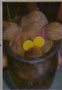
pot avec du coton