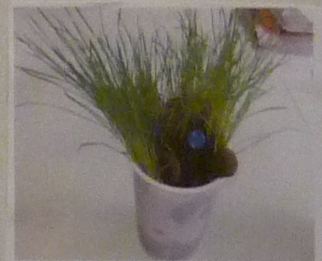
au soleil avec le terreau