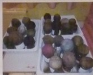
36 ans pû !