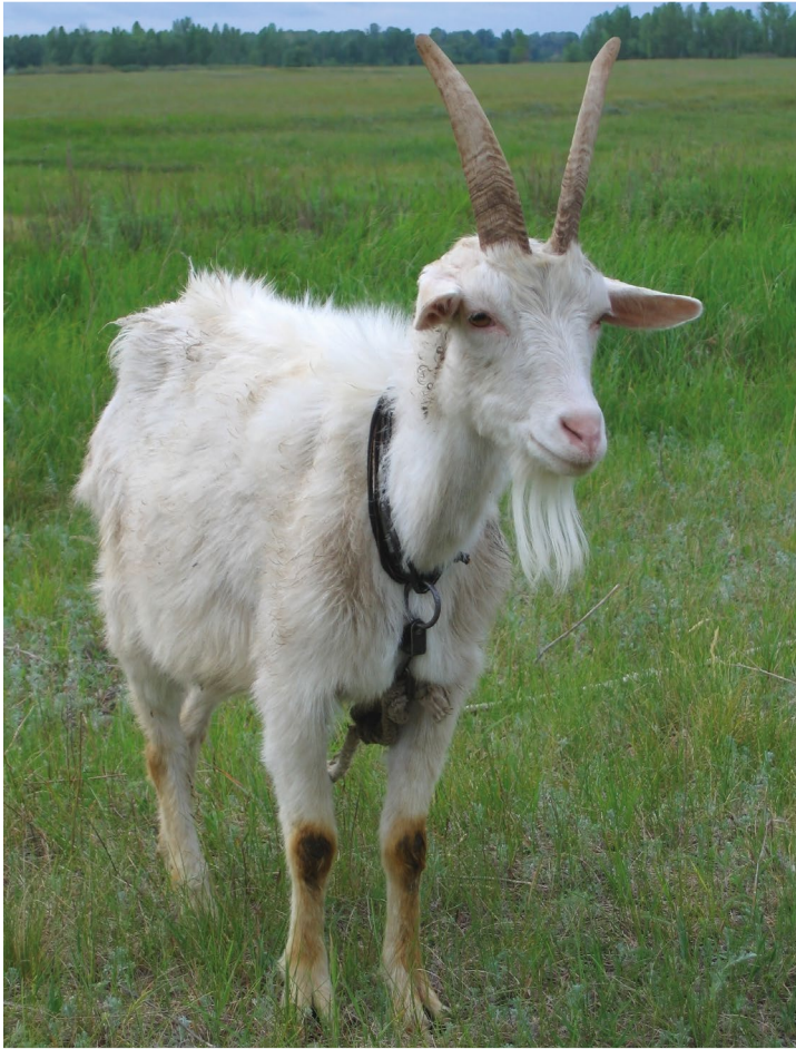
« Narramus », La chèvre Biscornue © Éditions Retz / © Istock